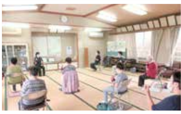
いきいき百歳体操

残念ながら、コロナ禍によりバス旅行や体育館でのカラオケ大会、スポーツ大会は中止となり、各単位クラブで開催していた親睦会なども中止が続いています。そのような中でも、屋外で「三密」を回避できるグラウンド・ゴルフやベタンク、ゲートボール等は活動を続けています。町老連が主催する大会以外にも普段から練習を重ねて、様々な大会に参加している会員もいます。生きがいや健康増進につながっています。