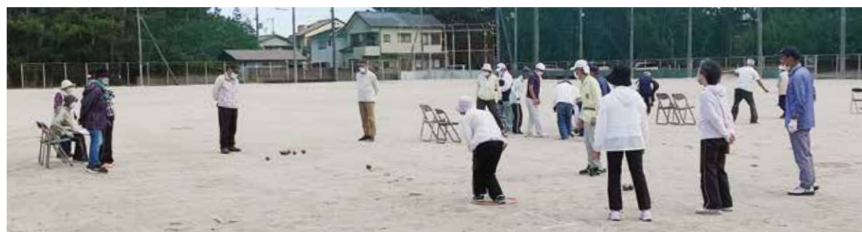
美浜町老連 「いきいき百歳体操」(上段) 「ペタンク大会」(下段)