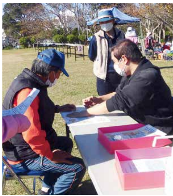
串本町老連 「健康相談コーナー」