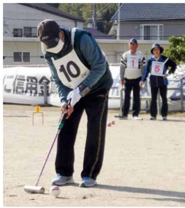
串本町老連 「ゲートボール大会」