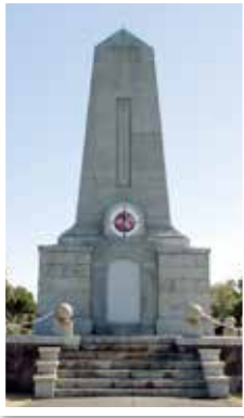
トルコ軍艦遭難慰霊碑

トルコのエルトゥールル号遭難時の町民による救助活動、真珠貝採取を目的としたオーストラリア北部の木曜島への渡航の歴史、日本初上陸となるアメリカ商船の来航時の町民との交流などの絆をもとに、それぞれの国の都市と姉妹都市及び友好都市提携を結んでいます。