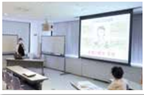
「歯とお口の健康について」講演の様様