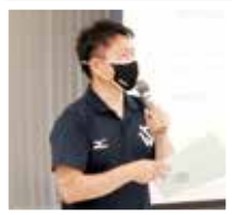
「いきいきクラブ体操」講演の様様

健康」と題したお話をいただきました。その中で、両側でバランスよく噛んで食べることが、肥満の解消やアンチエイジングにつながり、唾液腺のマッサージにより唾液分泌を増やすことで、歯周病や免疫力低下を防ぐ効果があることを教わりました。そして、歯周病は歯を失う最大の原因であると同時に、認知機能低下や心疾患、糖尿病などにも関係するとのお話でした。健康でいるために、お口のケアは避けて通れないことがわかりました。